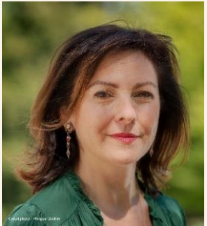
Carole Delga Présidente de la Région Occitanie / Pyrénées-Méditerranée

“ Mon ambition en matière sportive s’articule autour d’un double objectif : assurer le rayonnement de la région aux niveaux national et international et permettre à tous les habitants de pratiquer un sport sur l’ensemble du territoire en soutenant aussi bien les petits clubs que les équipements sportifs locaux. Je suis donc fière que l’Occitanie soit devenue la région la plus sportive de France avec près de 3,5 millions de pratiquants. L’Occitanie est également devenue en quelques années une terre d’accueil incontournable des grands événements sportifs qui contribuent au rayonnement de son territoire. ”